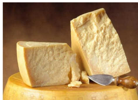
Parmigiano Reggiano – det perfekta komplementet till Amarone och Recioto

Druvor: Corvina Veronese 75%, Rondinella 20%, Molinara 5% Alkohol: 12,5%