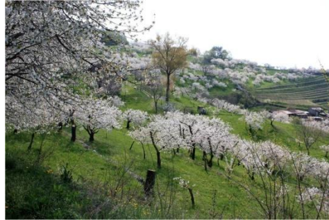
Körsbärsträd som blommar under april-månad